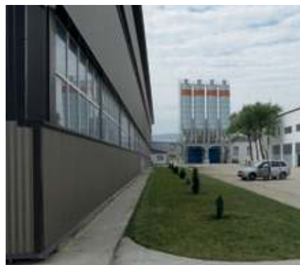
Blick auf die Gebäudefassade mit nebenstehender Mischanlage