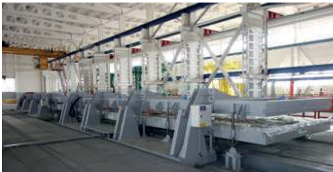
Klapp-Paletten zur Fertigung von Doppelwänden und Elementdecken

Auch die Ausfahrwagen zum Transport der Betonteile ins Außenlager und alle Abschalssysteme (Hersteller Ratec) wurden von Avermann mitgeliefert.