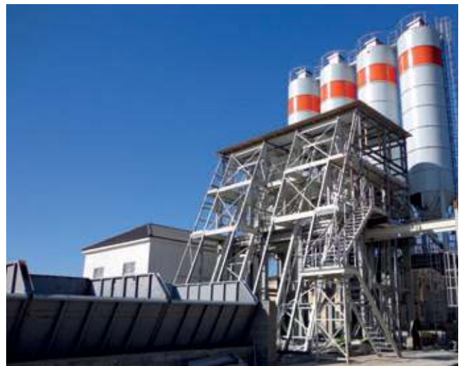
Teka-Mischanlage während der Aufbauphase

Beide Planetenmischer haben zwei Entleerungsöffnungen. Die eine Entleerung versorgt eine Kübelbahn mit Werksbeton, wobei die andere Entleerung alternativ Fahrmischer mit Transportbeton versorgt.