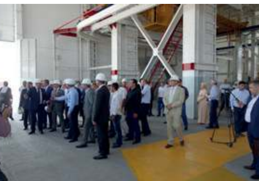
Präsentation der Anlage im Rahmen der feierlichen Eröffnung des Werkes am 22. Juli 2015

Weiter im Lieferumfang von Avermann waren entsprechende Maschinen zum Betonieren (Betonverteiler in Portalausführung mit Abziehvorrichtung sowie zwei Betonierkübel) und anschließenden Glätten (Flügelglätter für Normalbeton und Rüttel-Glätzwalze zum Verdichten von Leichtbetonen).