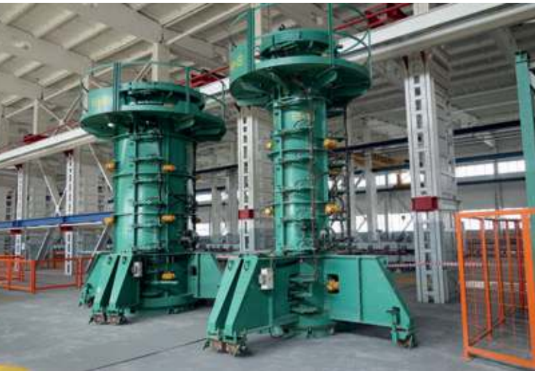
Formen für die Herstellung von Betonrohren