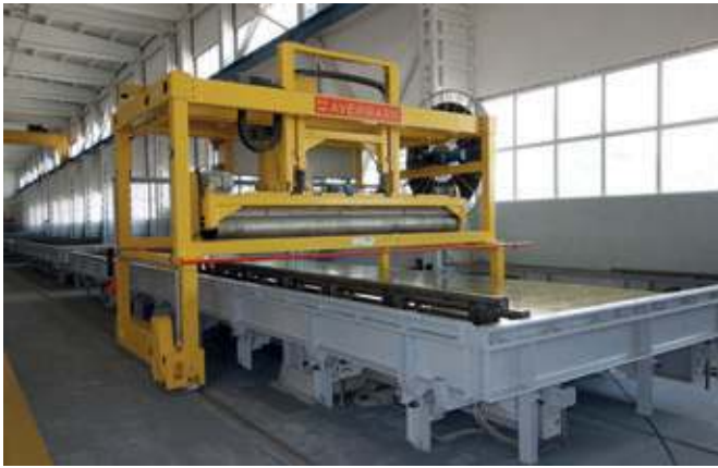
Blick in eine der beiden Fertigungshallen mit Kipptischen und Glättmaschine